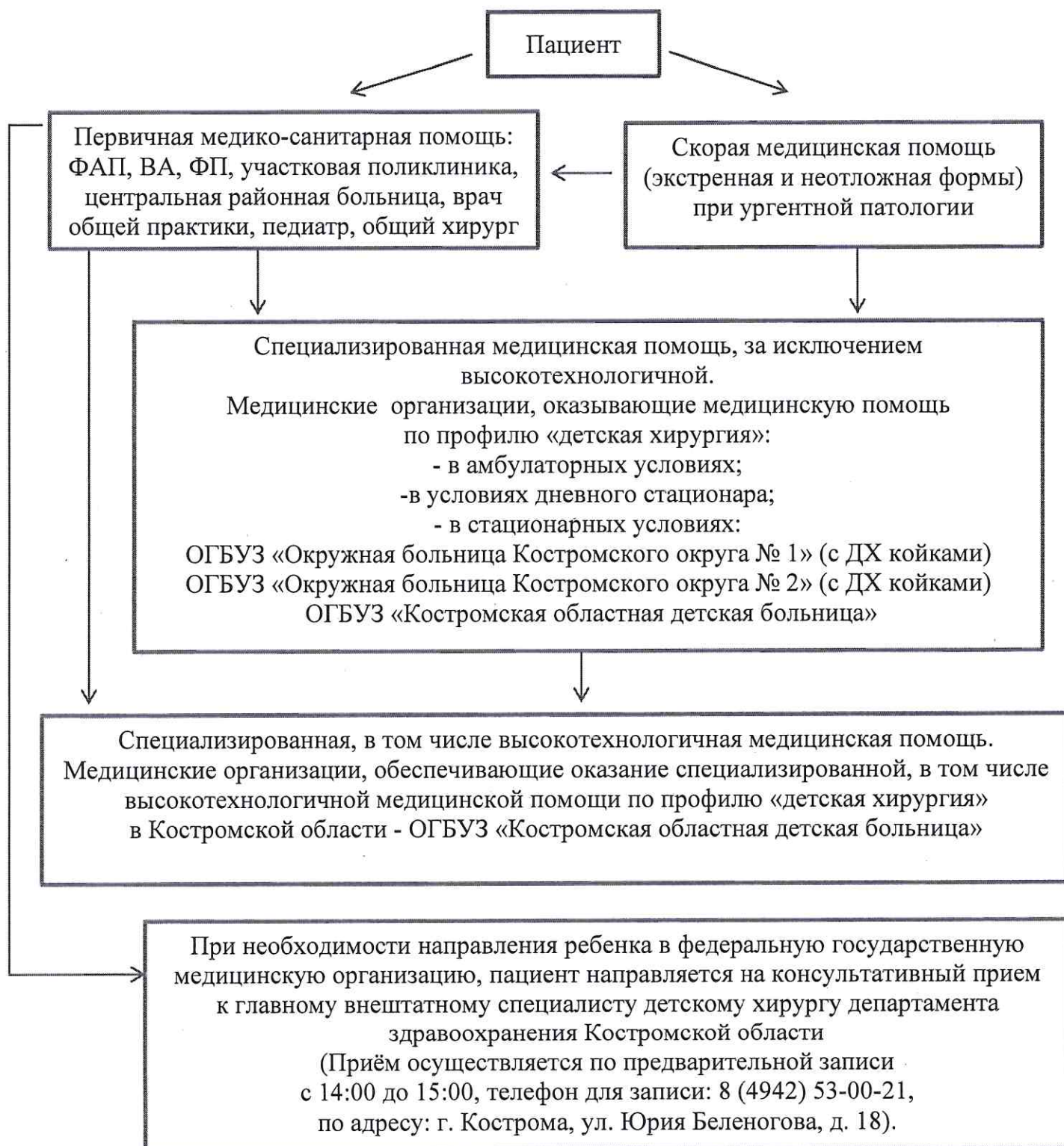
Схема маршрутизации пациентов при оказании медицинской помощи детскому населению по профилю «детская хирургия» в Костромской области

УТВЕРЖДЕНА приказом департамента здравоохранения Костромской области от 18.11. 2024 года № 1375